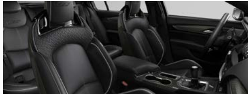
ריפודי עור שחורים עם תיפורים אדומים *אופציה בתוספת תשלום