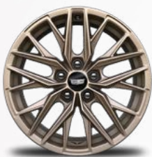
חישוקי אלומיניום 19" בגימור ברונזה - RHL *בתוספת תשלום