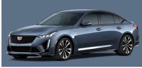
אפור מידייט מטאלי | GXU *בתוספת תשלום