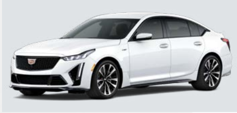
לבן | GAZ