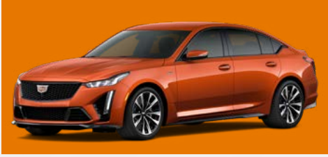
כתום מטאלי | GCF *בתוספת תשלום