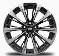
חישוקי אלומיניום 19" בגימור גרפיט - Q63