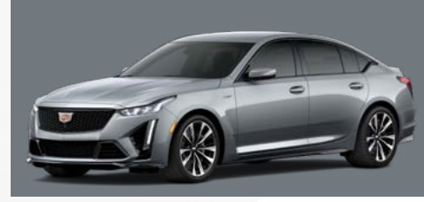
אפור סטרלינג מטאלי | GXD *בתוספת תשלום