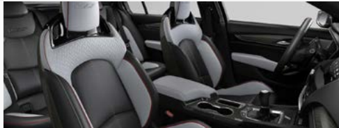
ריפודי עור אפורים עם תיפורים אדומים *אופציה בתוספת תשלום