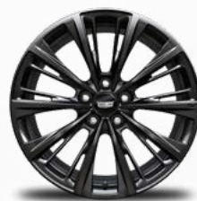
חישוקי אלומיניום 19" בגימור גרפיט מושחר - Q61 *בתוספת תשלום