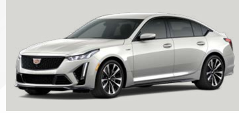
לבן אפרפר מטאלי | GRW *בתוספת תשלום