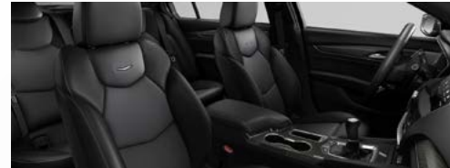
ריפודי עור שחורים עם טקסטורת ספורט