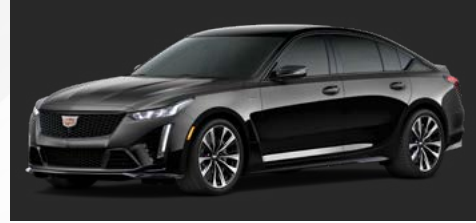
שחור | GBA