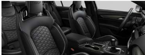
ריפודי עור שחורים עם טקסטורת ספורט *אופציה בתוספת תשלום