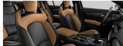
ריפודי עור קאמל עם תיפורי ספורט אדומים *אופציה בתוספת תשלום