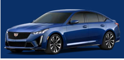
כחול ים מטאלי | GKK *בתוספת תשלום