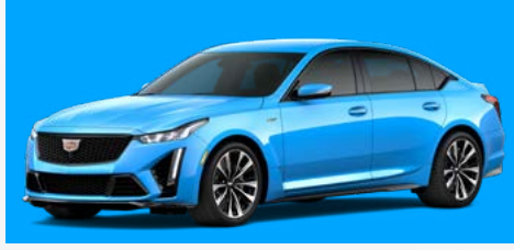
תכלת | GMO *בתוספת תשלום