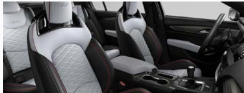
ריפודי עור אפורים עם תיפורים אדומים *אופציה בתוספת תשלום