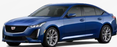
נחול ים מטאלי | GKK *בתוספת תשלום