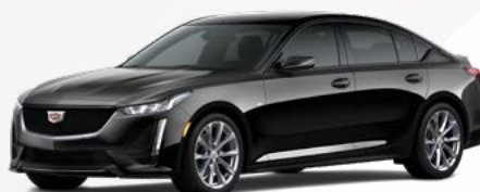
שחור | GBA