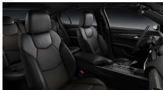
ריפודי עור בצבע שחור