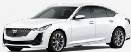
לבן פסגה | GAZ