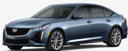
אפור מידייט מטאלי | GXU *בתוספת תשלום