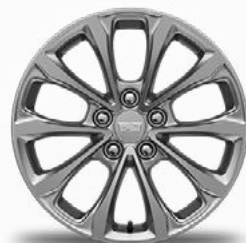
חישוקי 18" בגימור כסוף - 57R PREMIUM LUXURY