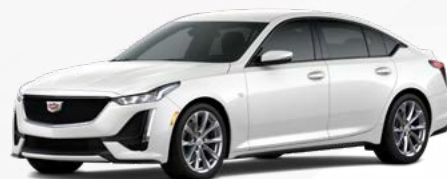
לבן קריסטל | G1W *בתוספת תשלום