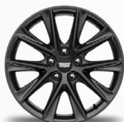
חישוקי 19" בגימור גרפיט מושחר - 57M SPORT