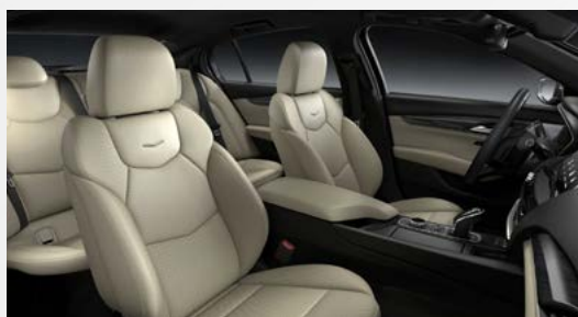
ריפודי עור בצבע סהרה בז'