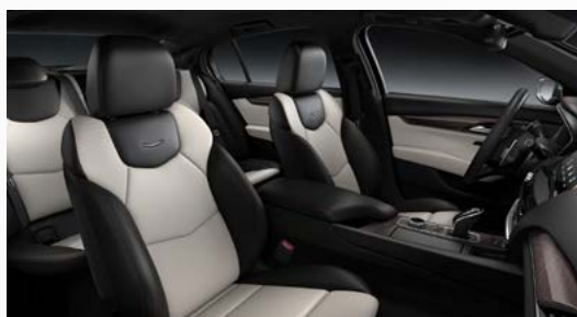
ריפודי עור בשילוב צבעים בז' ושחור