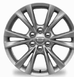
חישוקי אלומיניום 18" PREMIUM LUXURY