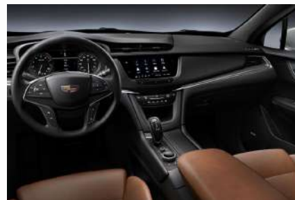
עור חום סדונה עם דשבורד שחור