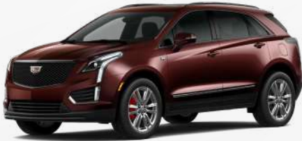
בורדו מטאלי | G6K