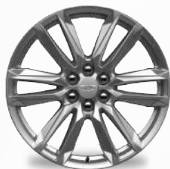
חישוקי אלומיניום 20" SPORT