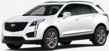
לבן קריסטל | G6W *בתוספת תשלום