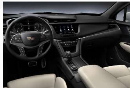
עור לבן אפרפר עם דשבורד אפור כהה או שחור