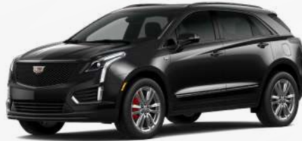
שחור כוכב מטאלי | G6B