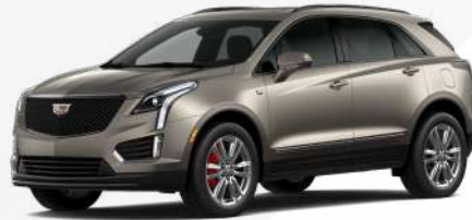
בד' מטאלי | G65