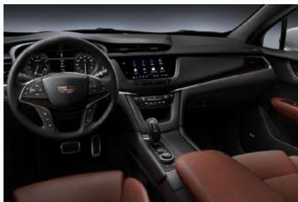
עור חום כהה עם דשבורד שחור