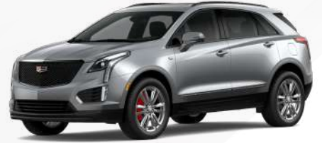
אפור סטרלינג מטאלי | G6D